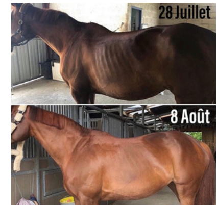
Pack Reboost (= Natural'Digest couplé au Natural'Immune)