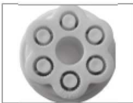
Pièce pour rigatoni