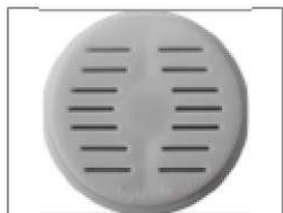
Pièce pour tagliatelle