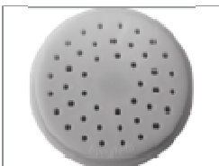
Pièce pour spaghetti