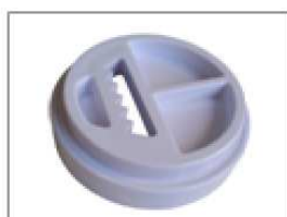
Pièce pour les biscuits