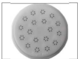
Pièce pour capellini (cheveux d'ange)