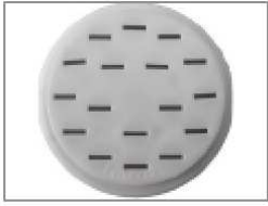
Pièce pour fettuccine