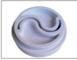
Pièce pour tortellini