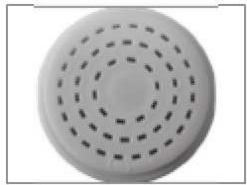
Pièce pour linguine