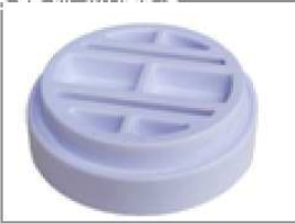
Pièce pour lasagne