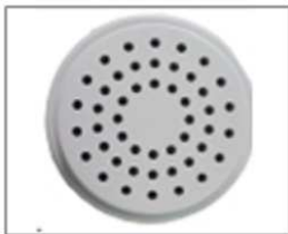
Pièce pour les nouilles orientales /nouilles asiatiques